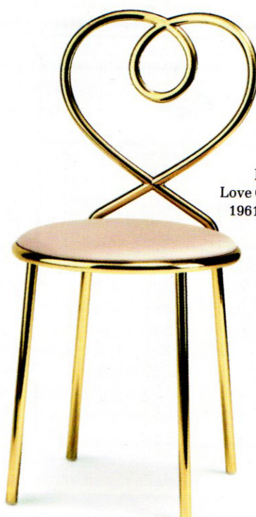
La sedia Love Chair, Ghidini 1961, 1.960 euro.