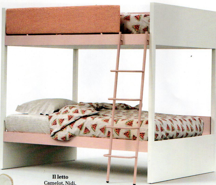
Il letto Camelot, Nidi, prezzo su richiesta.