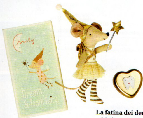
La fatina dei denti Maileg, 25 euro.