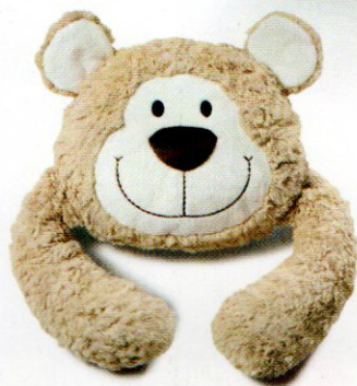
Il cuscino orsetto Nici, 25,99 euro.