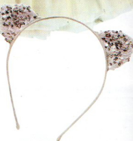
Il cerchietto Wild & Gorgeous, 19 euro.