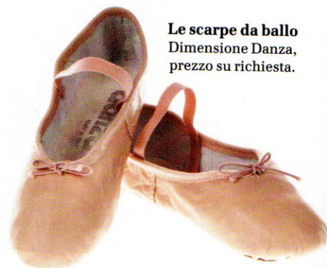
Le scarpe da ballo Dimensione Danza, prezzo su richiesta.