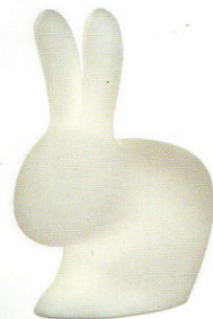
La lampada Rabbit Lamp, Qeeboo, 169 euro.