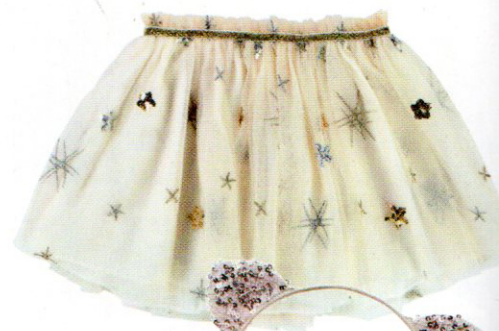
Il tutù Billieblush, 55 euro.

Il letto a castello (per invitare un'amica a dormire), l'orso di peluche, il tutù e le scarpette da ballerina... Ecco i pezzi per ricreare il romantico mondo di Cleo a casa vostra