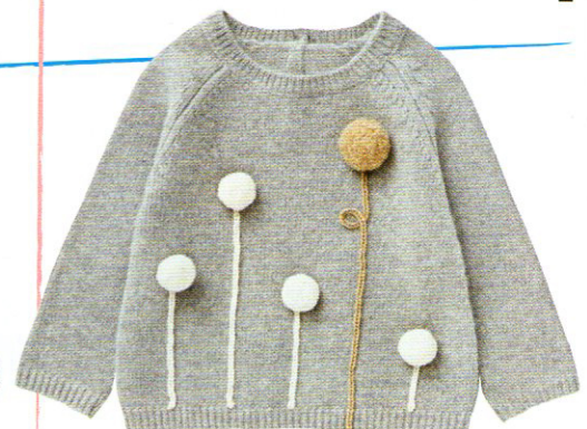
Pull di lana con motivo di pompon sul davanti, IL GUFO .