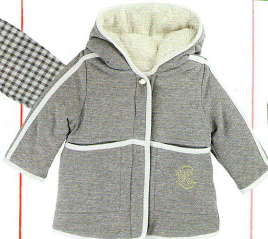
Giacchina imbottita con interno di lana e cappuccio, CHLOÉ (€ 165).