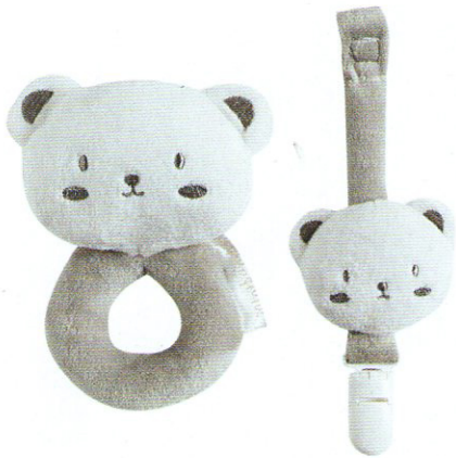
Kit con portaciuccio e sonaglio per neonati, MINIBANDA .

Per i primi mesi, un corredo romantico e un po' rétro, giocato sui toni del grigio