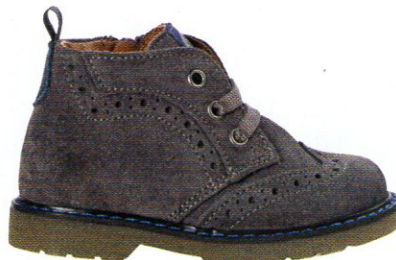
Scarpine scamosciate con stringhe e suola di gomma, WALKEY (€ 79,50).