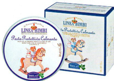
Pasta protettiva calmante senza parabeni, contro le irritazioni da pannolino, HELAN (€ 12).