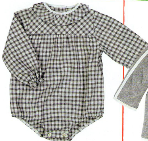
Body di cotone a quadretti con maniche lunghe, I MARMOTTINI (€ 49).