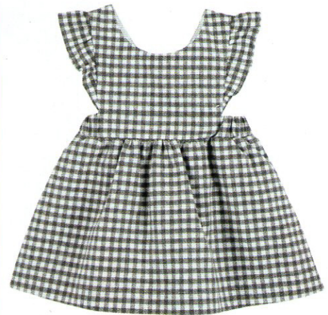
Abitino di flanella senza maniche con ruches, CHICCO (€ 32,99).