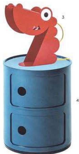
1/ Chaise Tripp Trapp réglable, design Peter Opsvik, 105 €. Stokke. 2/ Petit cartable bleu en coton marine, brodé « CM1 », 180 €. L/UNIFORM. 3/ Lampe Dragon en métal, 95 €. Bleu Carmin Designs chez The Conran Shop. 4/ Rangement Componibili , 2 tiroirs, 88 €. Kartell. 5/ Lit HUG , 90 x 190 cm, avec tête de lit rembourrée, 1970 €. Nidi. 6/ Affiche On Tour , 24 x 30 cm, édition limitée « écrivain », 45 €. Pleased To Meet chez Smallable. 7/ Guitare Rock en bois, 2490 €. Alinéa.