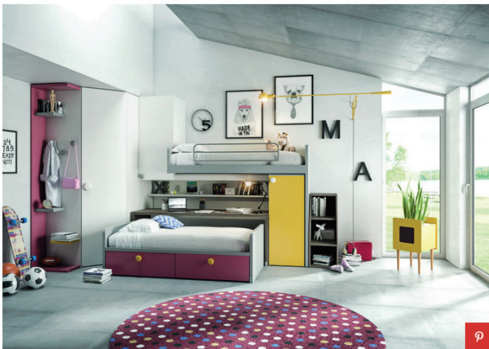
Camerette a ponte Tumidei, soluzione dinamica Tiramolla