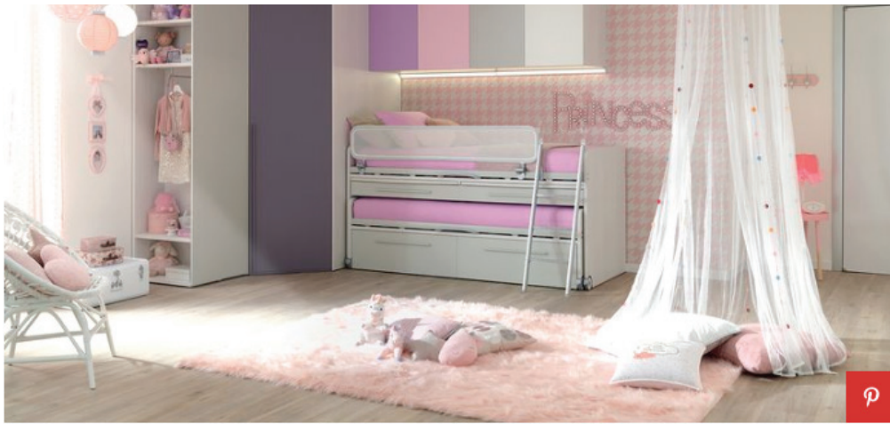
Camerette a ponte, soluzione KC403 di Moretti Compact