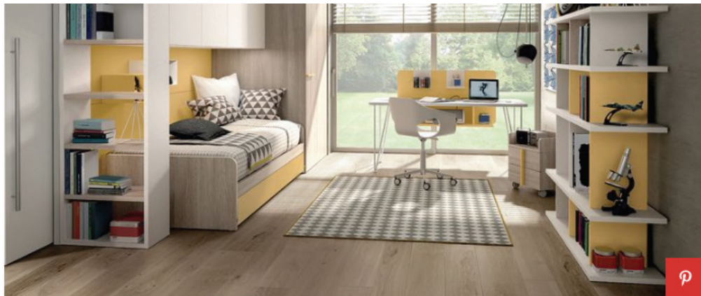
Camerette a ponte, soluzione Z478 di Zalf