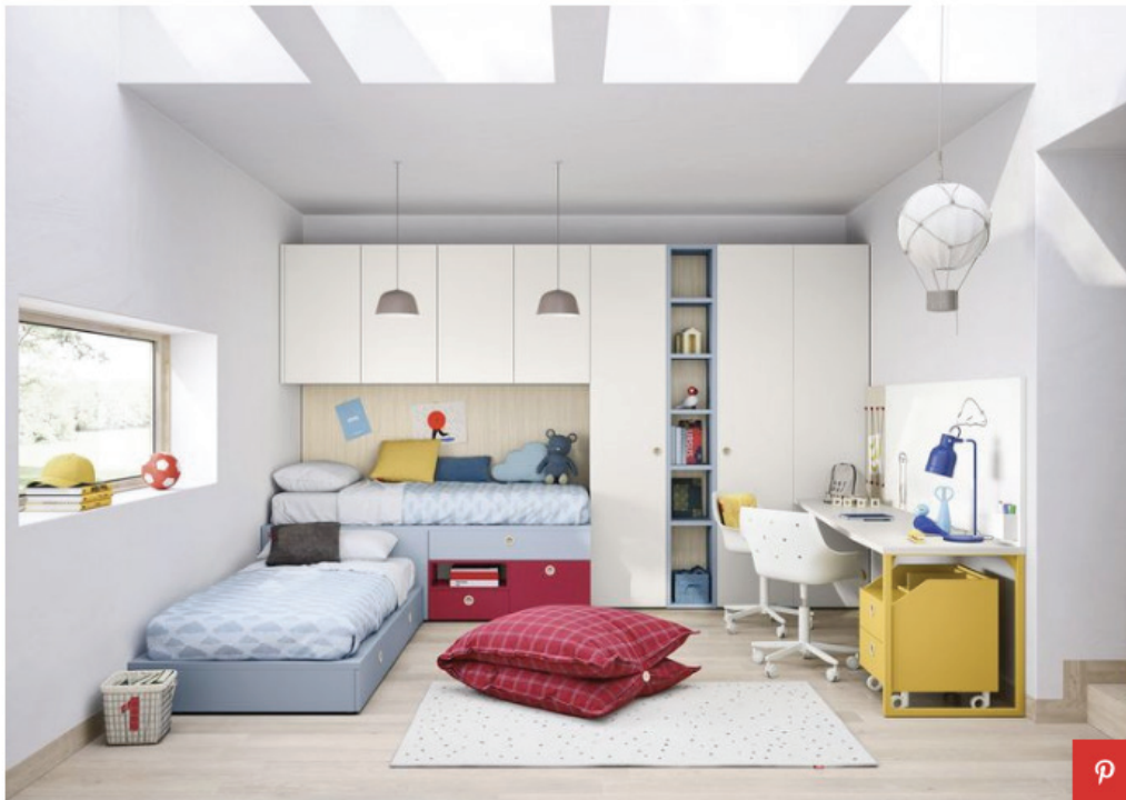
Camerette a ponte Nidi, soluzione con 2 letti singoli e armadi a ponte