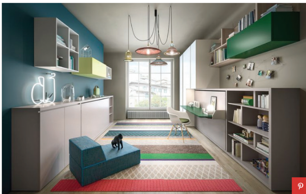
Camerette a ponte, Soluzione Kali di Clei